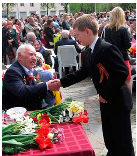
Представитель пятого поколения Кашириных охотно общается с ветеранами во время празднования Дня Победы.